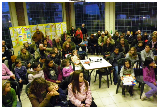
La premiazione del concorso Cari Nonni 2010

Se c'è una cosa per cui vale la pena impegnarsi, è cercare ogni giorno di essere se stessi.