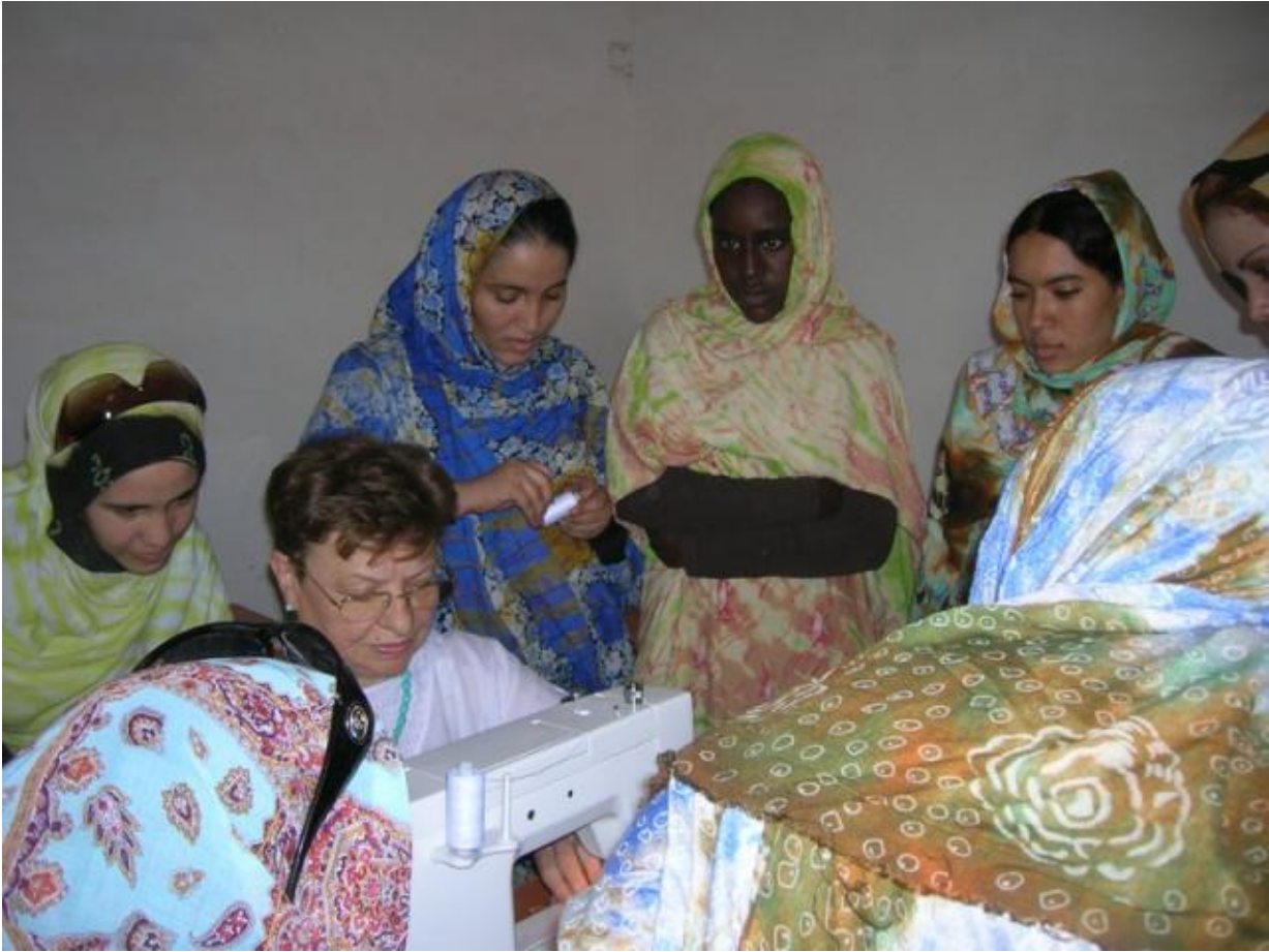
Volontariato Auser in Saharawi