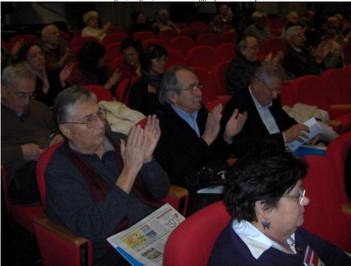
Uno scorcio della platea