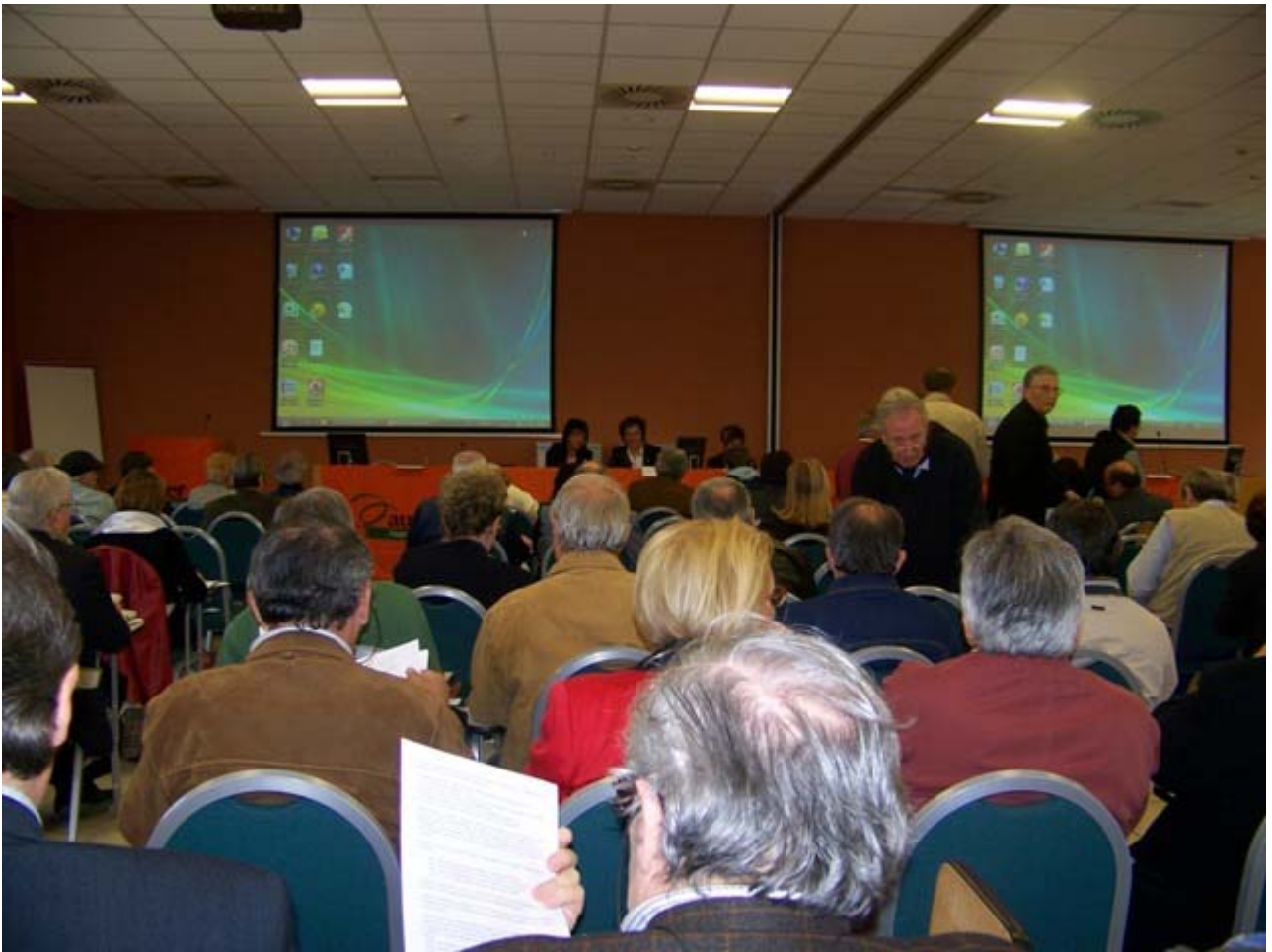
Uno scorcio del Convegno.